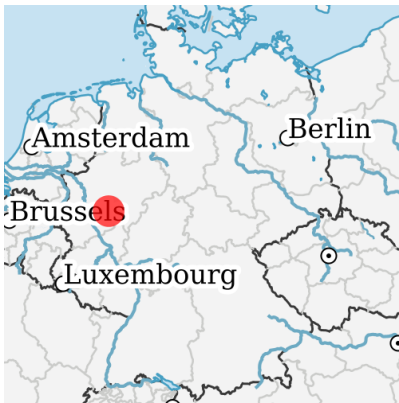
Lage in Deutschland