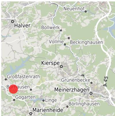
Lage in der Kommune